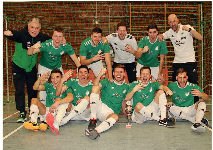
Turniersieger 2019: SV Auersmacher I