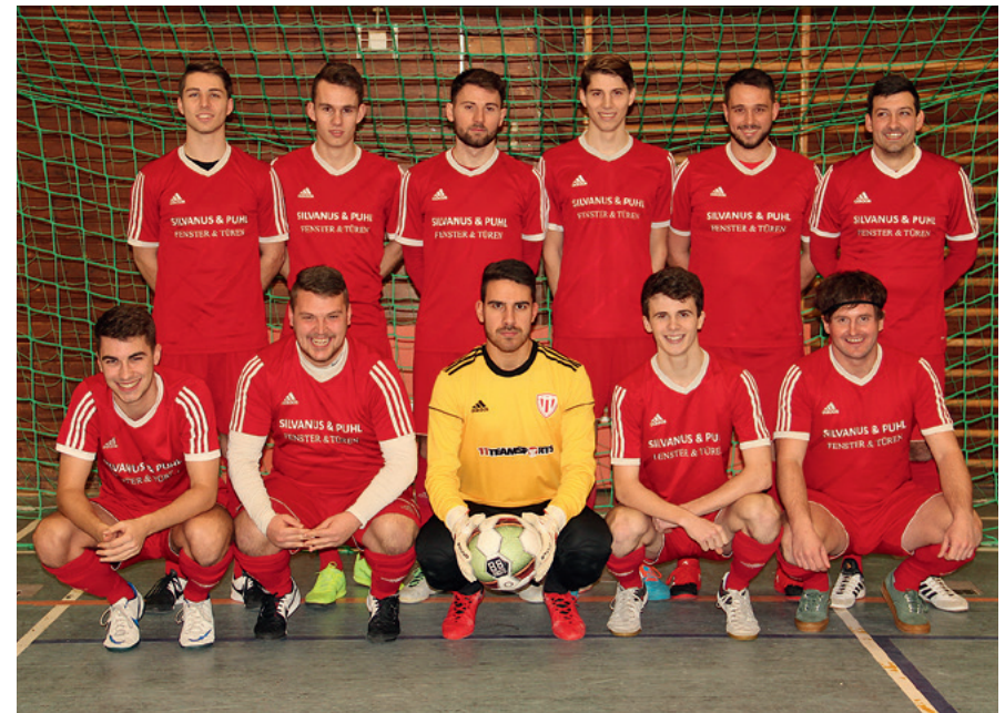
Platz 3: SV Bliesmengen-Bolchen