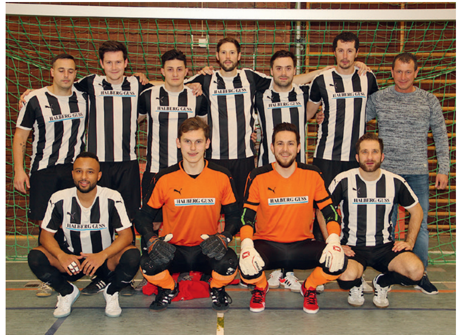
Platz 2: SC Halberg Brebach