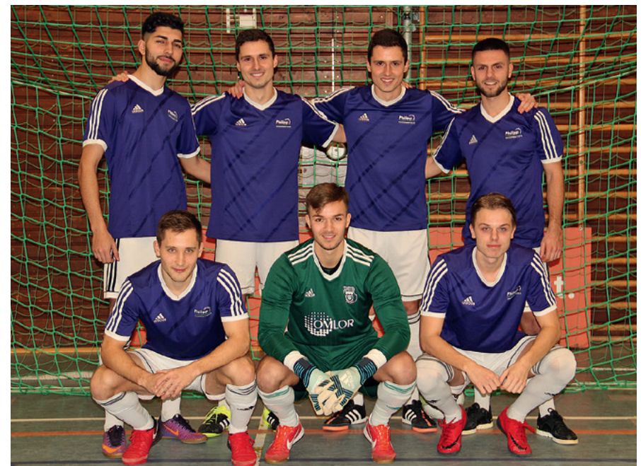
Platz 4: SV Jägersburg 2